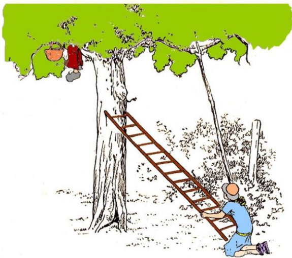
Sans bruit, elle fit glisser l'échelle.